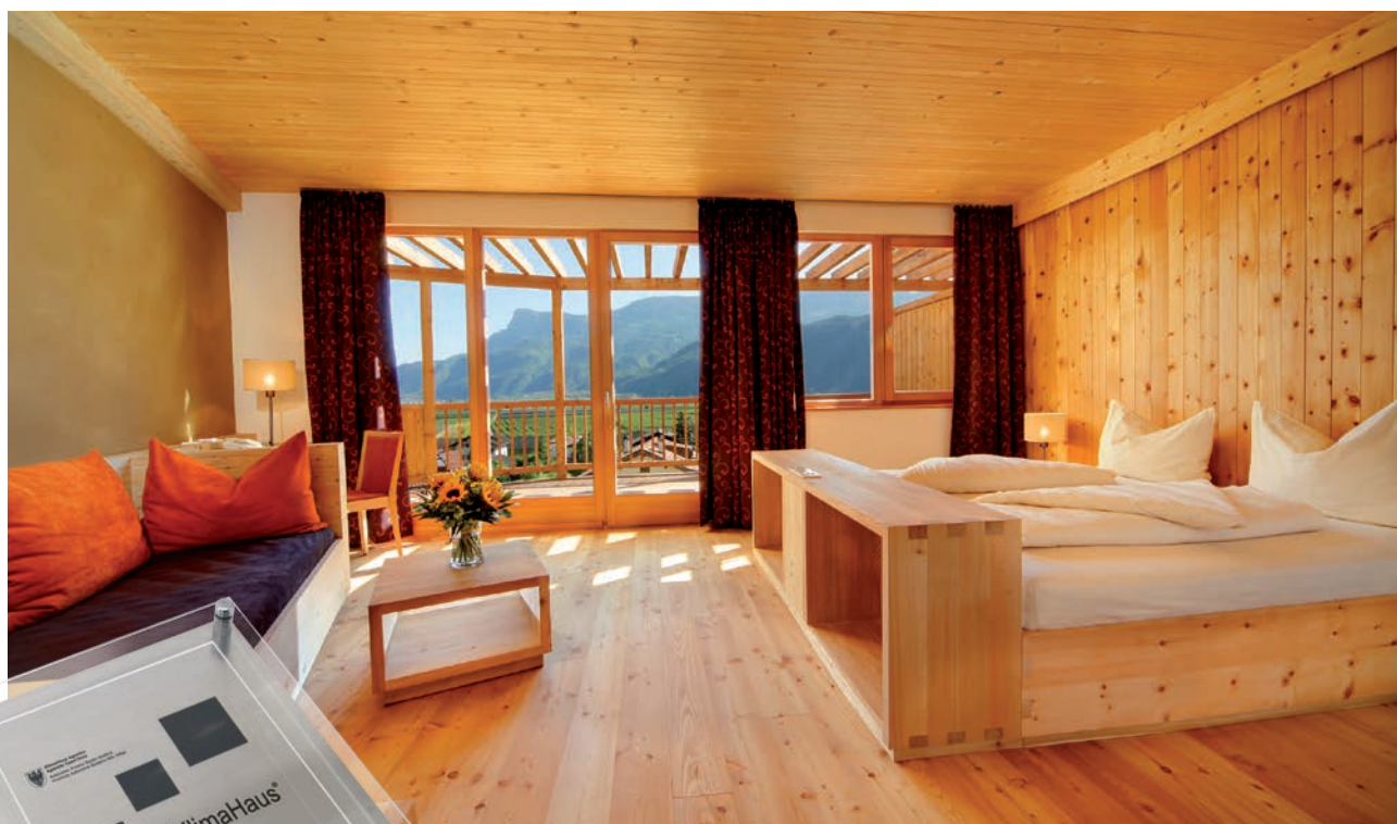
THEINER'S GARTEN BIOVITALHOTEL, Arch. Studio Baukraft