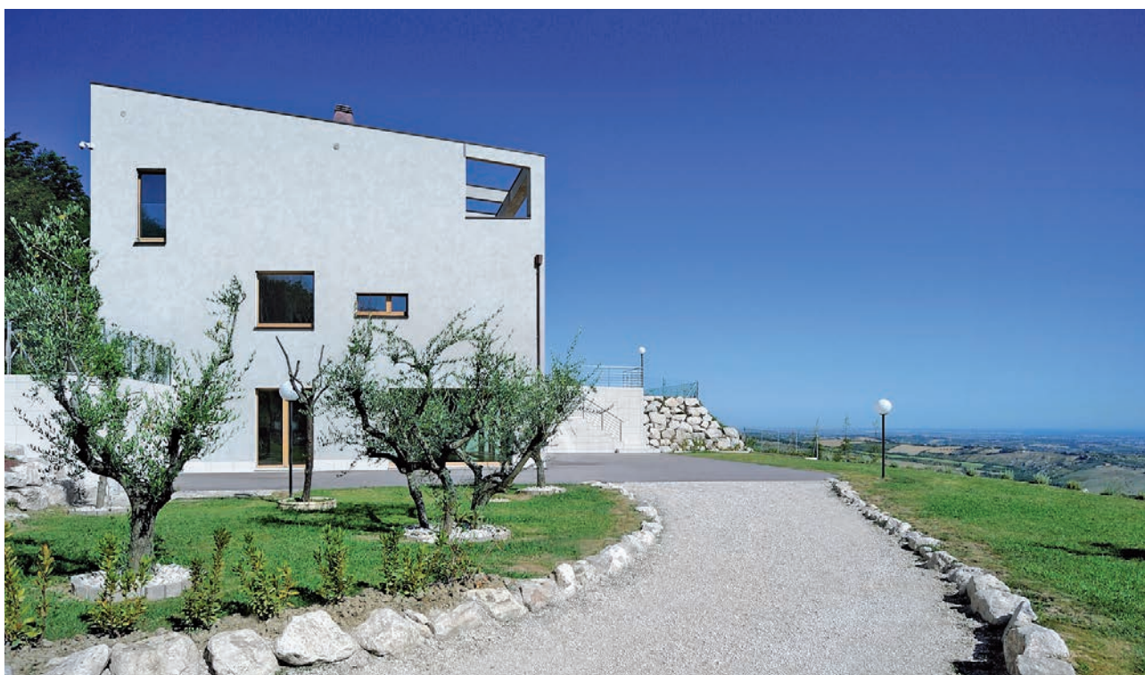
CASA MAGNANELLI, Arch. Manuel Benedikter