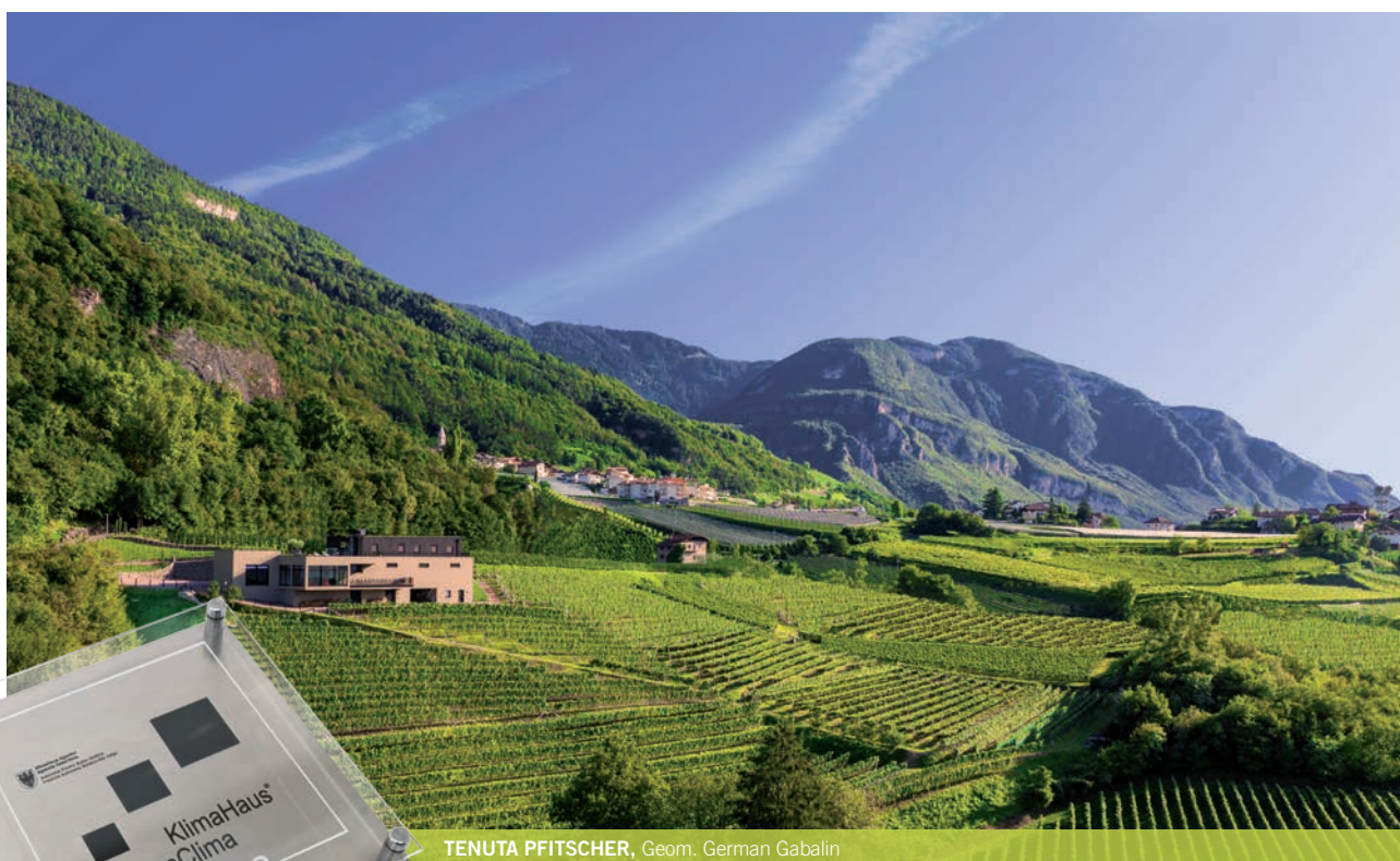
TENUTA PFITSCHER, Geom. German Gabalin