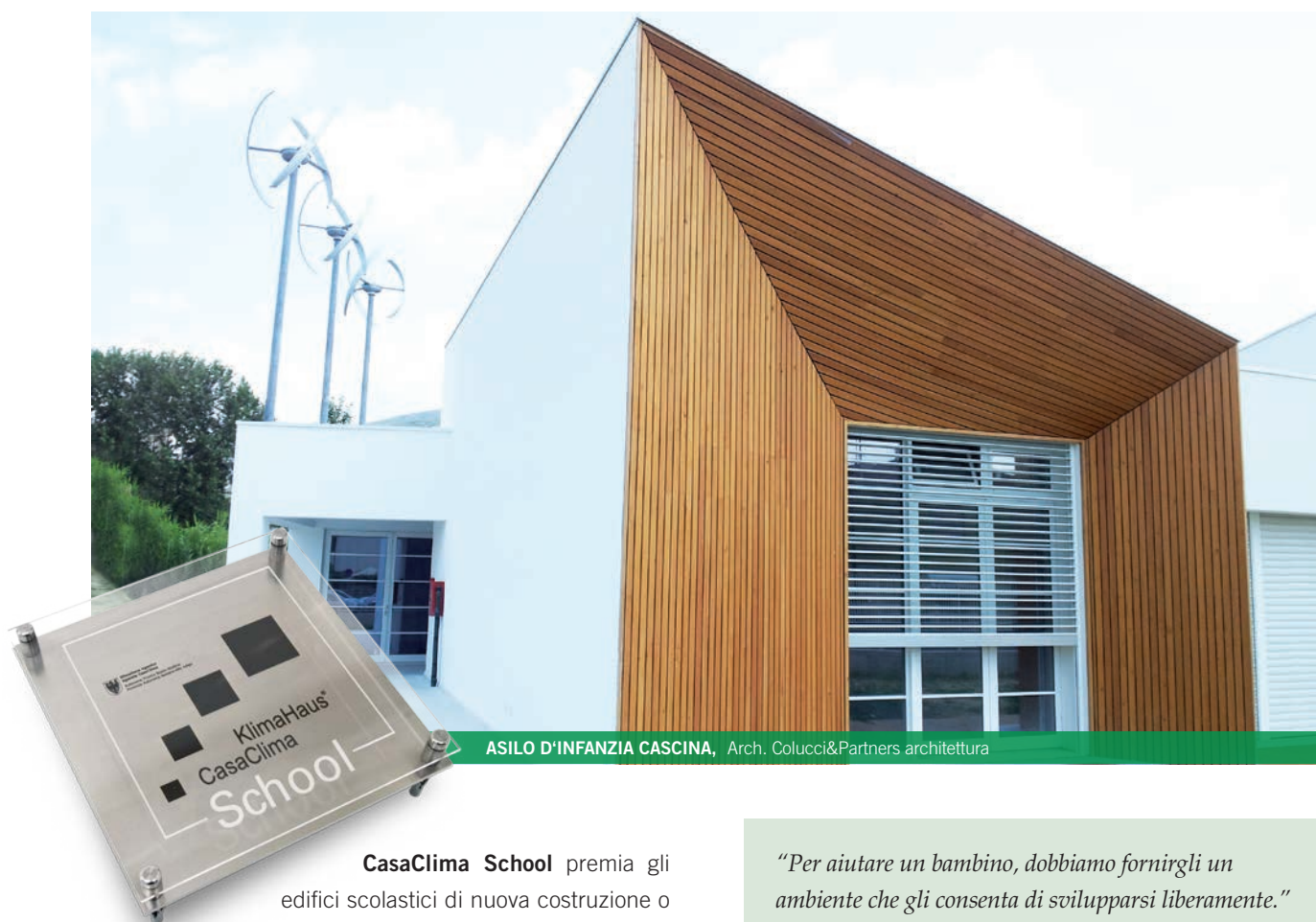
ASILO D'INFANZIA CASCINA, Arch. Colucci&Partners architettura

CasaClima School premia gli edifici scolastici di nuova costruzione o risanati, compatibili con un'idea di sostenibilità in cui vengono considerati sia gli aspetti ecologici che quelli sociali ed economici.