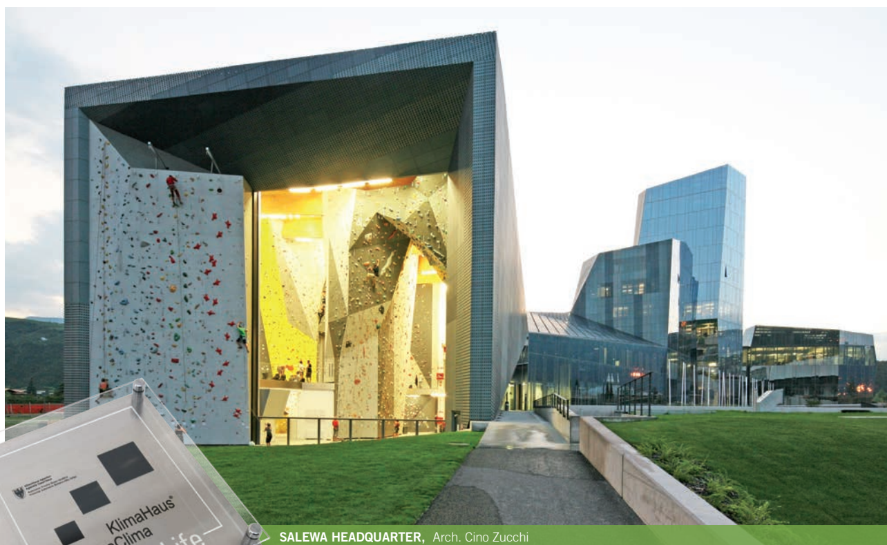
SALEWA HEADQUARTER, Arch. Cino Zucchi

Il sigillo di qualità CasaClima Work&Life è una certificazione di sostenibilità sviluppata per le specifiche esigenze del settore dei servizi. Nella certificazione vengono verificati e valutati criteri di sostenibilità sia in relazione all'efficienza energetica sia all'uso intelligente delle risorse.